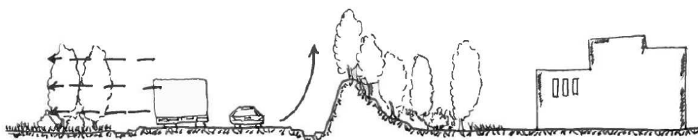
Esempio di effetto di attenuazione determinato dalle fasce di vegetazione associate anche alla formazione di terrapieni (in particolare per le aree prossime ad edificato residenziale esistente o in progetto)

24. La valutazione di clima acustico dovrà inoltre permettere l'individuazione di eventuali misure di mitigazione dell'impatto acustico da adottarsi quali in particolare la predisposizione di fasce di vegetazione e terrapieni che prevedano anche l'inserimento di elementi vegetazionali. Tali fasce potranno essere realizzate, qualora l'entità dell'impatto dell'infrastruttura lo richieda, anche su terrapieni (come da immagine riportata di seguito) e dovranno contribuire alla mitigazione paesaggistica degli elementi infrastrutturali individuati. Le superfici a verde garantiscono un buon livello di attenuazione (circa 4,6 dBA per ogni raddoppio della distanza), superiore a quello delle superfici dure (cemento, lastricato, ecc.) che registrano invece un livello di attenuazione di circa 3 dBA per ogni raddoppio della distanza (Fonte: "Linee guida per la progettazione ambientale delle aree destinate a insediamenti produttivi", Provincia di Padova, Assessorato all'Urbanistica, 2007).